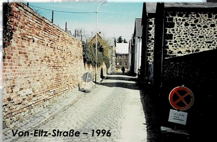
Von-Eltz-Straße – 1996