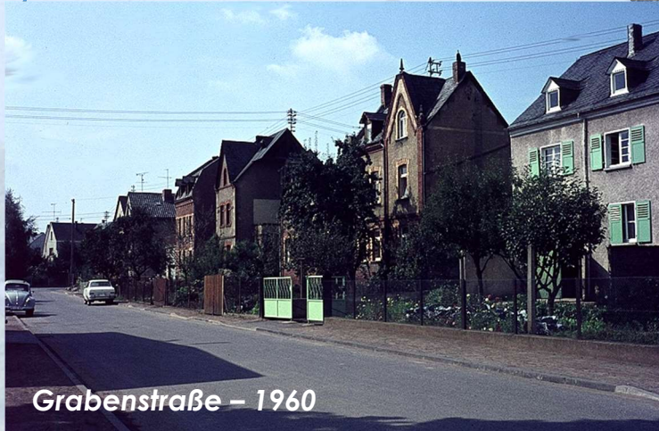
Grabenstraße – 1960