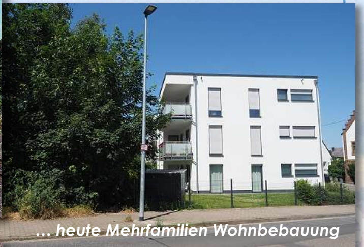
... heute Mehrfamilien Wohnbebauung