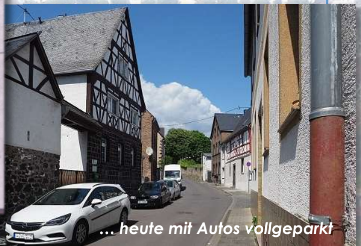
... heute mit Autos vollgeparkt