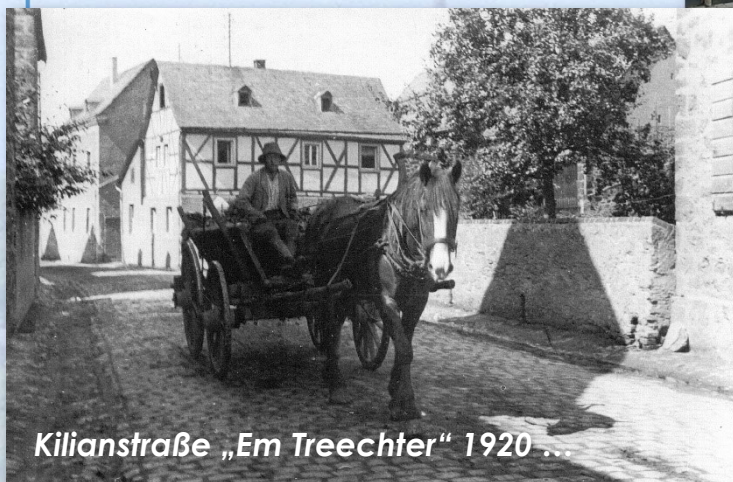
Kilianstraße „Em Treechter“ 1920 ...