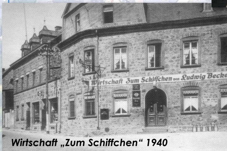
Wirtschaft „Zum Schiffchen“ 1940