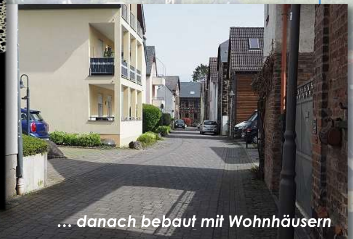
... danach bebaut mit Wohnhäusern