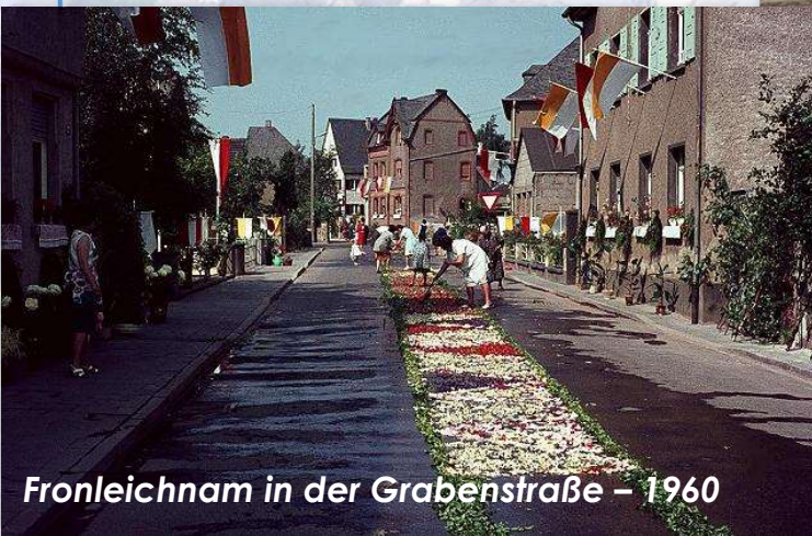
Fronleichnam in der Grabenstraße – 1960