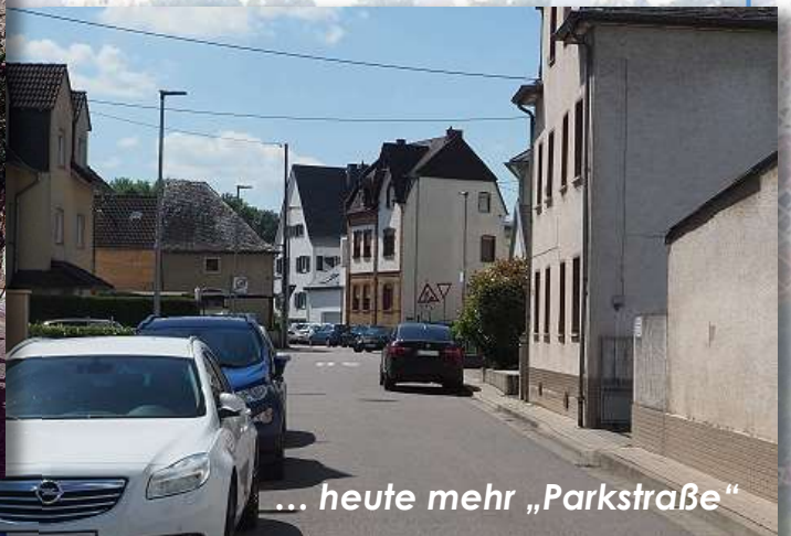
... heute mehr „Parkstraße“