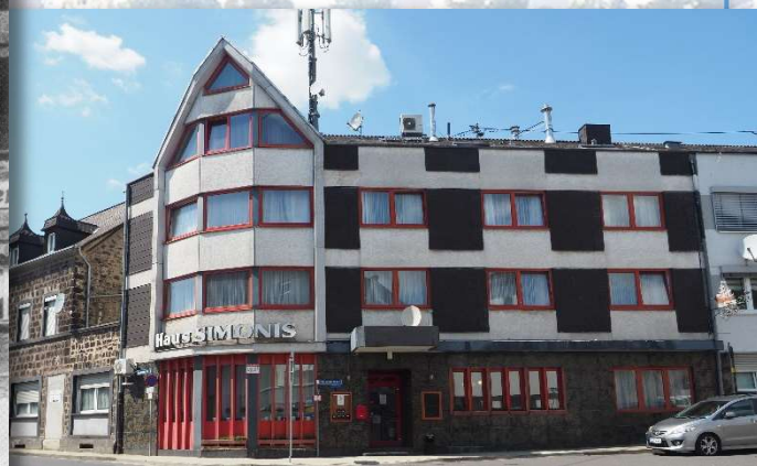
... heute Hotel Simonis