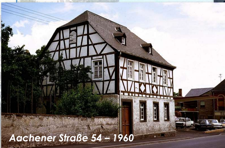
Aachener Straße 54 – 1960