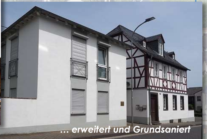
... erweitert und Grundsaniert