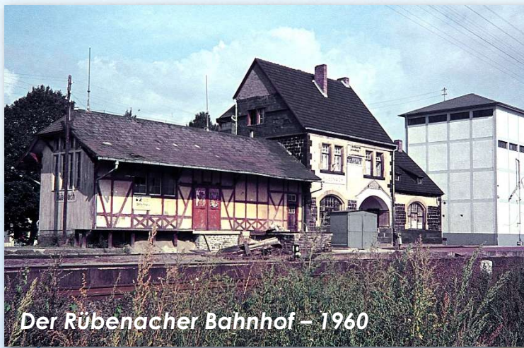
Der Rübenacher Bahnhof – 1960