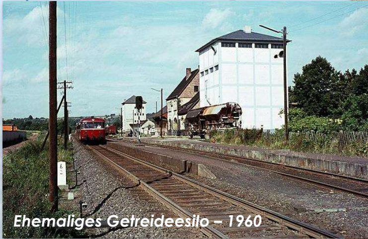
Ehemaliges Getreideesilo – 1960