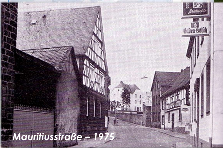
Mauritiusstraße – 1975