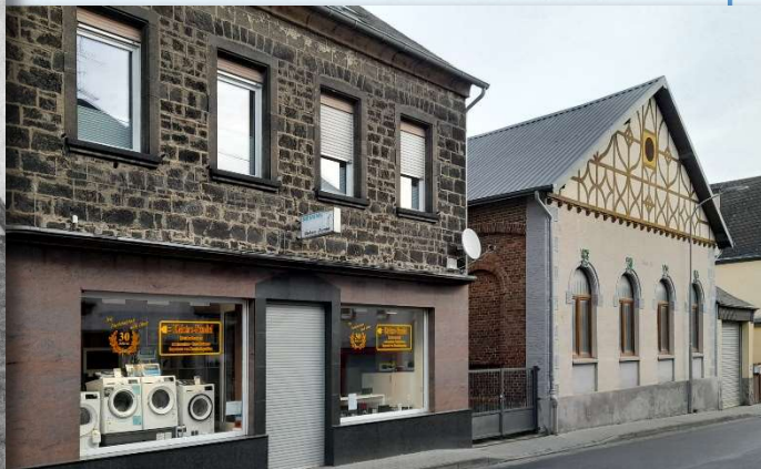
... heute Elektrogeschäft Fondel