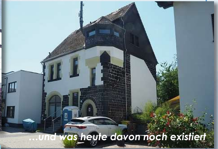
...und was heute davon noch existiert