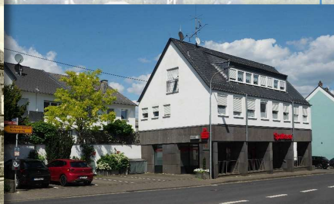
... heute Sparkasse Rügenach