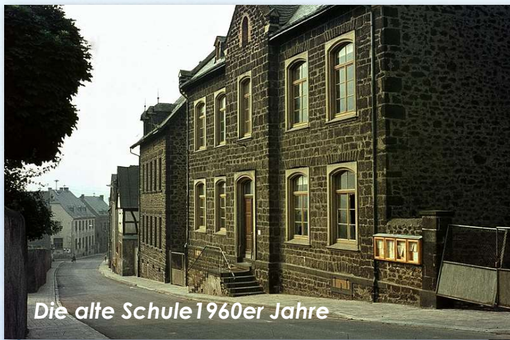
Die alte Schule 1960er Jahre