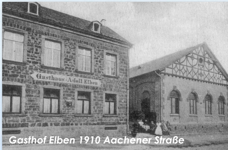
Gasthof Elben 1910 Aachener Straße