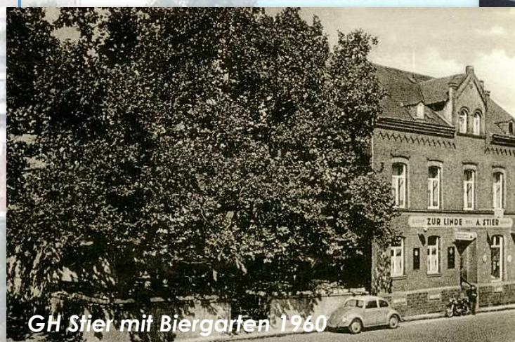
GH Stier mit Biergarten 1960