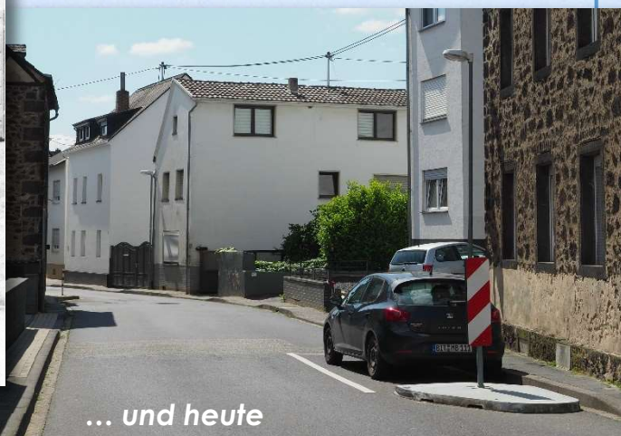
... und heute